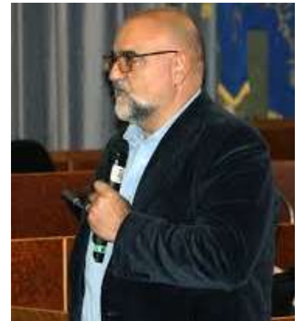
SoZooAlp 2014 - Gemona (UD)