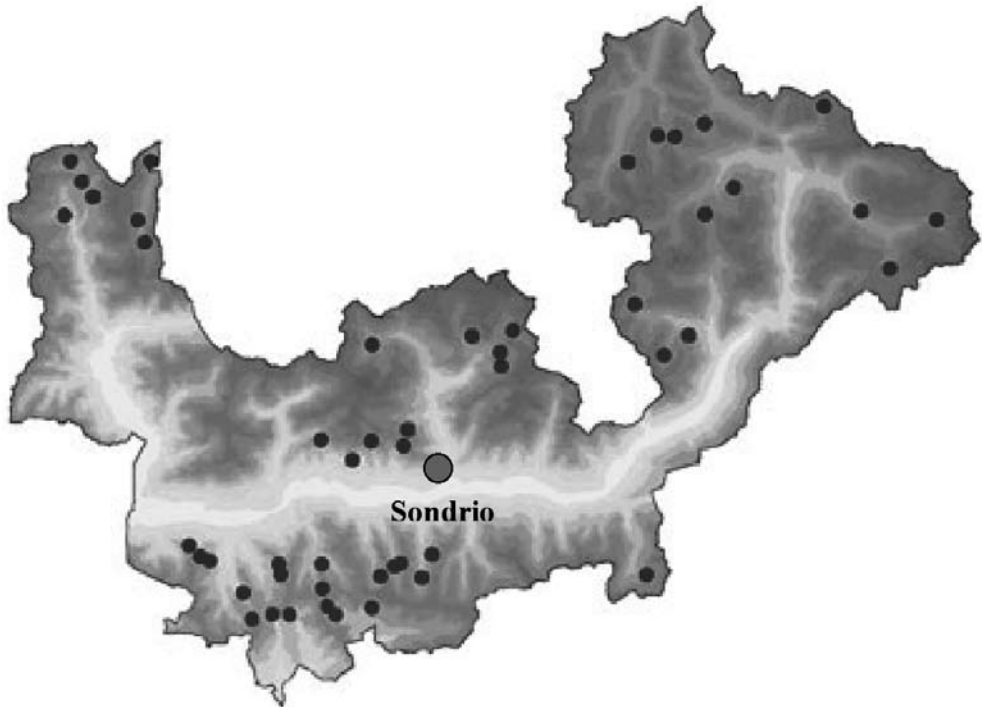
Figura 1 - Dislocazione delle malghe di provenienza delle forme entro l'area di produzione del Bitto.

Le sue caratteristiche qualitative, oltre che dall'abilità del casaro, dipendono quindi molto dalle condizioni di produzione: animali, pascolo, alimentazione, condizioni climatiche, ambienti e così via. In questo lavoro si è indagato l'effetto di alcune variabili relative alla malga, all'alimentazione e agli animali. Per la malga e l'alimentazione si sono considerate, rispettivamente, la dimensione, correlata alla possibilità di lavorazioni in ambienti meglio attrezzati e controllati, e l'integrazione con concentrati, particolarmente delicata e dibattuta alla luce delle potenziali ripercussioni sulla tipicità del prodotto (Gusmeroli et al., 2001). Per gli animali sono state prese in esame le specie e le razze. In passato, le due variabili non ammettevano molte varianti, dal momento che il formaggio si produceva sempre da latte misto proveniente dalla razza bovina Bruna alpina e dalla razza caprina Orobica. Negli ultimi decenni, invece, la razza Bruna alpina è stata sostituita dalla Bruna e da altre razze, soprattutto Frisona e Pezzata rossa, mentre l'allevamento caprino è divenuto molto sporadico.