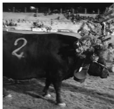
Figura 1 - a) Batailles de Reines a By, Aosta (Immagine tratta da Le montagnards sont là , Simonetti) ; b) scontro tra Regine durante la finale di Aosta e c) Regina delle Regine (per gentile concessione di Tessitore E.).

Incruento per gli animali, che rifiutano lo scontro nel momento in cui riconoscono nell'avversario un esemplare gerarchicamente superiore, le battaglie risultano estremamente affascinanti per i turisti. Al contempo, le competizioni richiamano l'attenzione degli allevatori, che seguono ormai da secoli le contese delle proprie beniamine, attribuendo agli esemplari di maggior temperamento e combattività un valore economico superiore. Attualmente non è in atto un processo di miglioramento di tale capacità, ma il considerevole interesse per le battaglie ha portato all'idea di avviare uno studio per la valutazione del carattere "attitudine al combattimento", sostenuto dalla collaborazione tra il Dipartimento di Scienze Animali dell'Università di Padova, l'Associazione Nazionale Allevatori Bovini di Razza Valdostana (AnaBoRaVa), l'Associazione Regionale Allevatori Valdostani (AREV), e la Regione Valle d'Aosta.